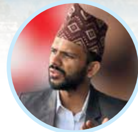
मा. सागर ढकाल प्रतिनिधि सभा सदस्य गुल्मी क्षेत्र नं. १